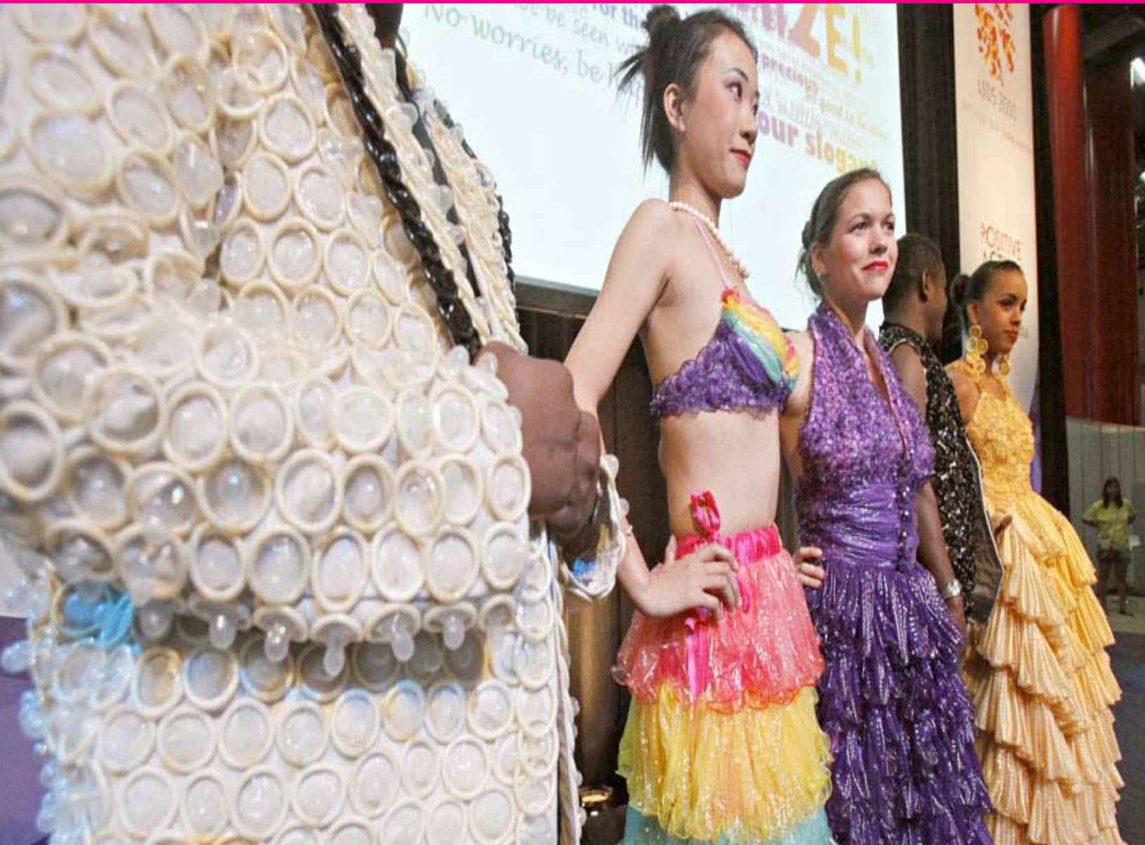
Diseños de vestimenta usando condones; presentación en la Conferencia Internacional sobre sida en Viena 2010