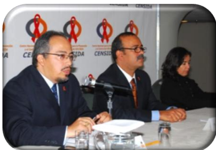
PANEL RUEDA DE PRENSA PARA MEDIOS ESP.EN SALUD

El día lunes 28 de febrero, se convocó a una rueda de prensa para los medios de comunicación social especializados en salud.