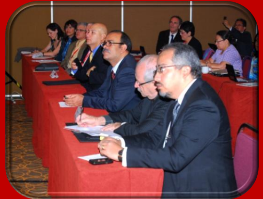
DR. JOSÉ A. CÓRDOVA VILLALOBOS SECRETARIO DE SALUD MEXICO