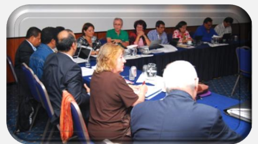
GCTH EN REUNIÓN PREPARATORIA CONSULTA

El Grupo se reunió con el objeto de realizar un análisis de Acceso Universal de la región en base al documento elaborado por la Secretaría Técnica-Administrativa de GCTH con miras a extraer recomendaciones para la Consulta Regional sobre AU.