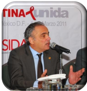
LUIZ LOURES (ONUSIDA SEDE) “SE QUE ESTA CONSULTA RENOVARÁ EL COMPROMISO DE TODOS HACIA EL ACCESO UNIVERSAL.”