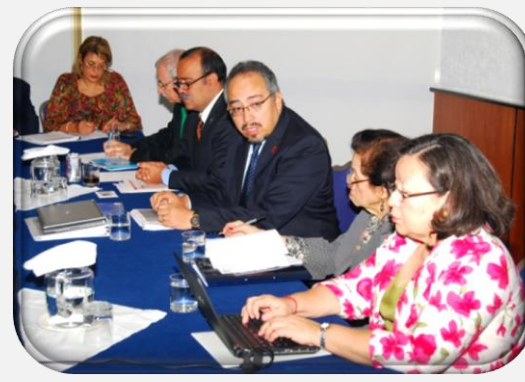
REUNIÓN PREPARATORIA DE LOS MIEMBROS LATINOAMERICANOS DEL PCB

la participación de Ministros, Vice-Ministros y otros altos funcionarios nacionales del sector salud así como la Dirección Regional de ONUSIDA