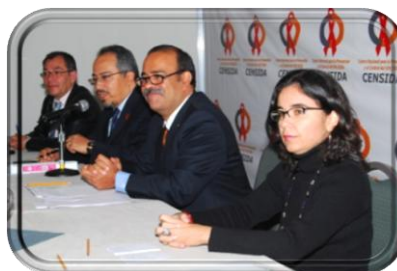
PANEL DE RUEDA DE PRENSA

Los integrantes del Presidium presentaron un breve resumen de la respuesta al VIH en sus respectivas instituciones así como de las expectativas cifradas en la Consulta Regional y los consensos esperados. En el conversatorio con la prensa, el Dr. Núñez se refirió a la situación de la respuesta al VIH en Latinoamérica, diferenciándola de lo que puede verificarse sobre el tema en otros continentes.