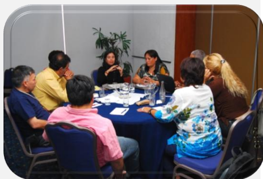
REUNIÓN PREPARATORIA (REDES SOC. CIVIL)

Entre ellas, podemos citar la reunión preparatoria de delegados de las redes de la sociedad civil de América Latina allí presentes. En ella, participaron: REDLACTRANS, REDTRASEX, MCM+ (Movimiento de Mujeres Positivas), ASICAL (Asociación para la Salud Integral y la Ciudadanía de América Latina y el Caribe), red de jóvenes (GYCA), REDLA+, LACASSO, ICW, MLCM+, COASE y REDLARD, las nueve redes regionales que conforman REDESLAC.