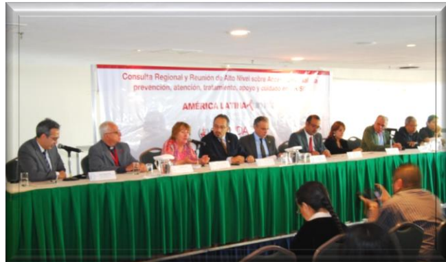
CONSULTA REGIONAL SOBRE AU: PANEL DE CONFERENCIA DE PRENSA DE ONUSIDA

Con un panel inclusivo donde estuvieron representados todos los sectores participantes en la Consulta, se llevó a cabo la Conferencia de Prensa organizada por ONUSIDA el día martes 1º de marzo.