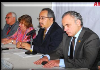
PANEL DE LA CONF. DE PRENSA