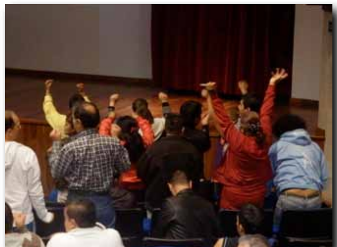
ASISTENTES EN LA DINÁMICA

¡HASTA PRONTO! NOS VEMOS EN EL IV SEMINARIO PARA PERSONAS CON VIH