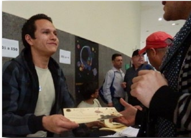
ENTREGA DE CERTIFICADOS