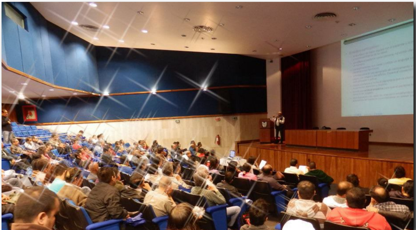
ASISTENTES AL SEMINARIO